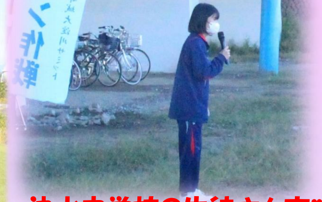
沖水中学校の生徒さん方!