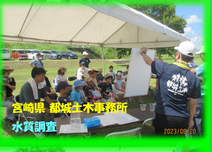
宮崎県 都城土木事務所 水質調査