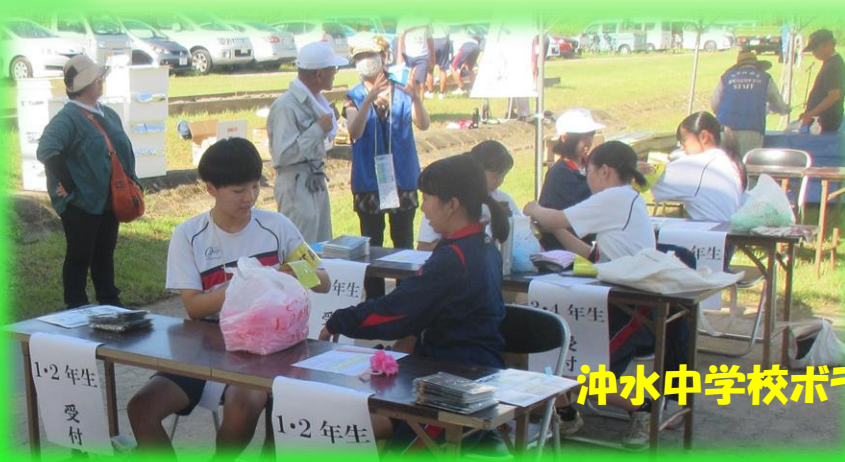
沖水中学校ボランティアの皆さん

コロナの感染症法の位置づけが5類に引き下げられた事で、4年ぶりの開催となったサミット最大イベント「大淀川こどもサミット大会」でしたが、久しぶりに子供たちの楽しそうな歓声を聞いた様な気がしました。 4年ぶりということで、会員さんの年齢もそれなりに高くなっており、マンパワー不足を感じる中で頑張ってもらったのが、沖水中学校のボランティアの皆さんや国土交通省・都城土木事務所・都城市環境政策課の行政の応援でした。力を、一番感じましたのが“団体会員”の企業の皆さんで、継続に当たってはこの力無くしては開催出来ないのでは？と痛感致しました。 2023年8月20日（日） 224名参加