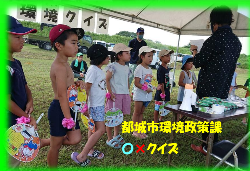
都城市環境政策課 ○×クイズ