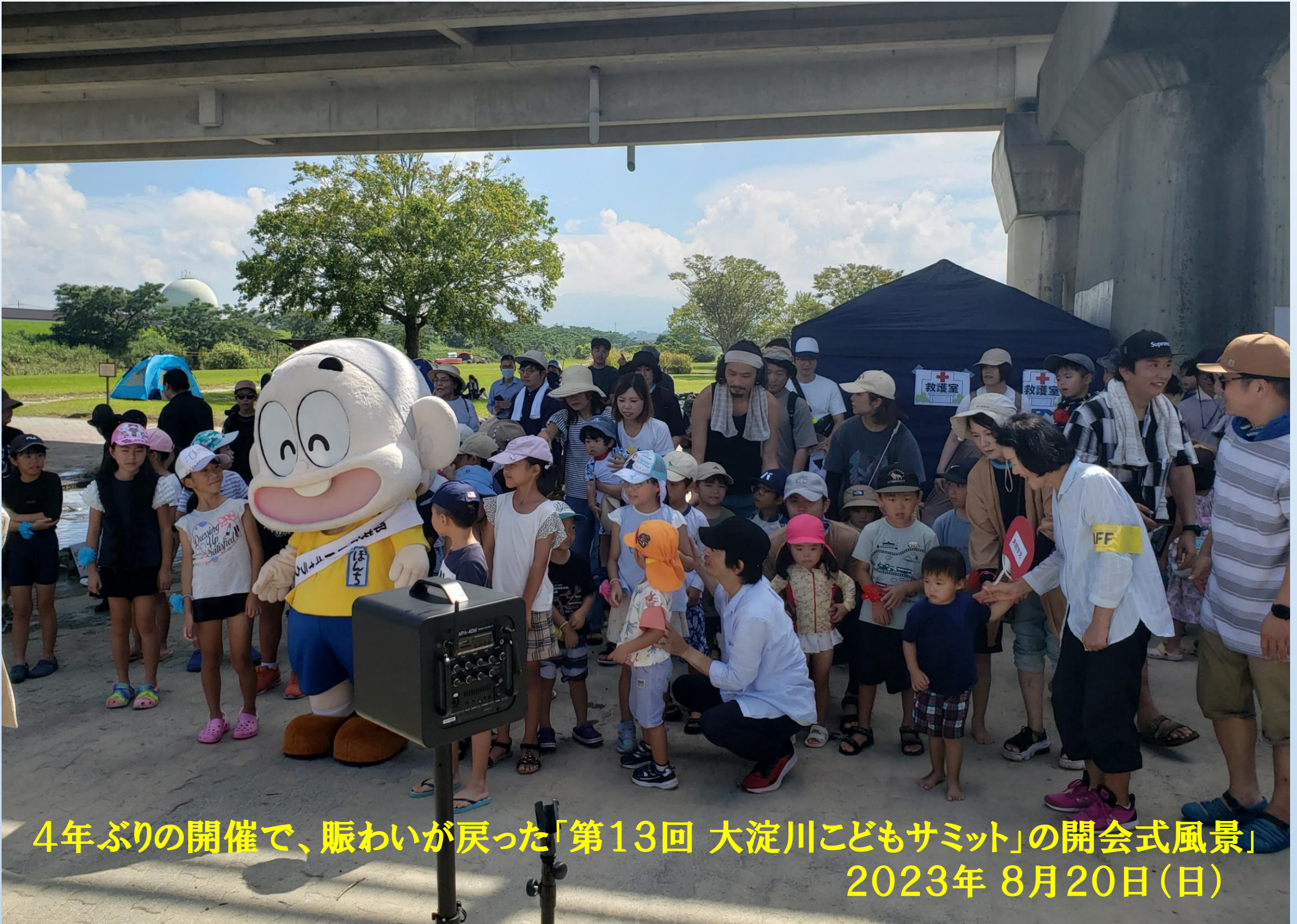
4年ぶりの開催で、賑わいが戻った「第13回 大淀川子どもサミット」の開会式風景 2023年 8月20日(日)