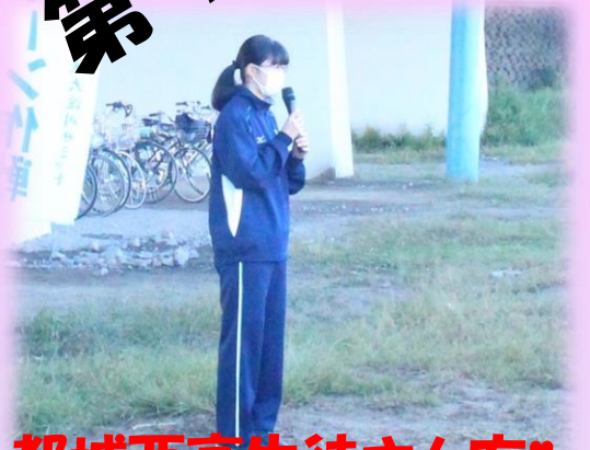
都城西高生徒さん方!