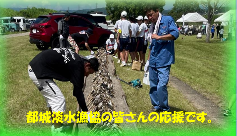
都城淡水漁協の皆さんの応援です。