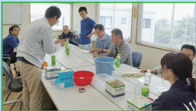
クリーン作戦後の「水質調査」