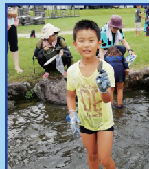
たくさん！捕まえた？