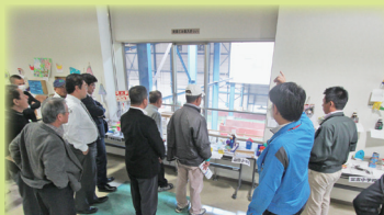
リサイクルについて、学び!