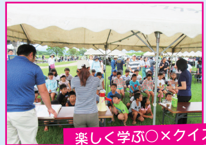
楽しく学ぶ〇×クイズ