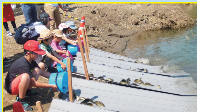
子ども達による「鯉の放流」