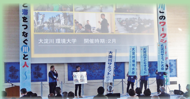
大淀川 環境大学 開催時期:2月

2019年第19回九州「川」のワークショップ in 佐賀。 NPO法人 都城大淀川サミットの活動紹介をして来 ました。