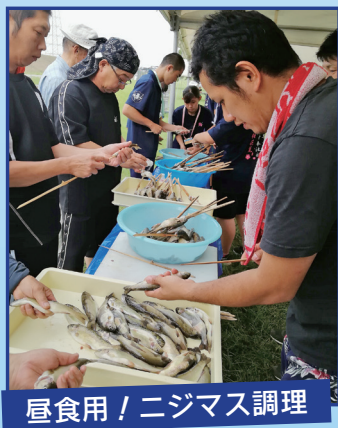
昼食用！ニジマス調理