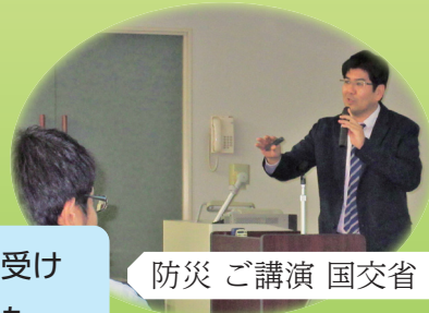
防災 ご講演 国交省