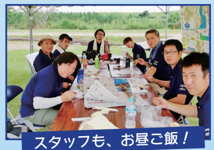
スタッフも、お昼ご飯！