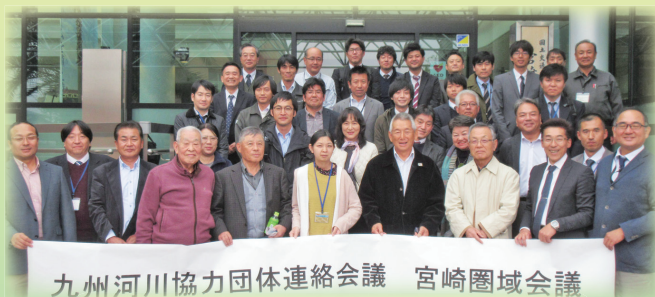
九州河川協力団体連絡会議 宮崎圏域会議