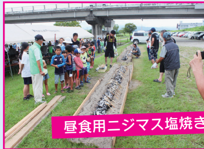
昼食用ニジマス塩焼き